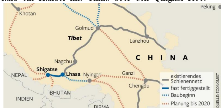
Abbildung 4: Tibets Schienennetz

Mit einer durchschnittlichen Höhe von 4.000m ü. N.N. war es schon immer schwer für die Tibeter einen geregelten Waren- und Personalverkehr mit ihren Nachbarn zu führen. Wegen seiner Höhe und dem Terrain war Tibet eine der letzten chinesischen Provinzen ohne ein Eisenbahnnetz. Zuvor fand ein Handel mit China über den Qinghai-Tibet Highway statt, welcher in den 50ern gebaut worden war. Mit Fertigstellung der 1.142 km langen Eisenbahnstrecke Golmud – Lhasa in 2006 wurde Tibet an das chinesische Netz angeschlossen. 33