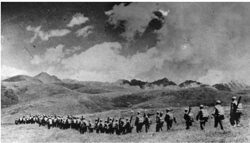
Abbildung 2: Soldaten der VR China um 1950 in Tibet

Nach dem Zusammenbruch der Qing-Dynastie (1911) und der Gründung der „Republic of China“ (ROC) im selben Jahr erklärte sich Tibet für unabhängig. Der militärischen Einnahme 1950 durch die chinesischen Revolutionsstreitkräfte 17 folgte 1951 das 17-Punkte-Abkommen, das China die politische Herrschaft sicherte, Tibet aber regionale Autonomie und dem Dalai Lama den Status quo gewährte. U.a. wegen der sozialistischen Reformen, die zur Landenteignung vieler Tibeter führten, kündigte der Dalai Lama das Abkommen auf und floh schließlich ins Ausland. 18 1959 wurden in Lhasa bei einem Aufstand ca. 10.000 Tibeter durch systematische Beschießungen von Chinesen ermordet. 19