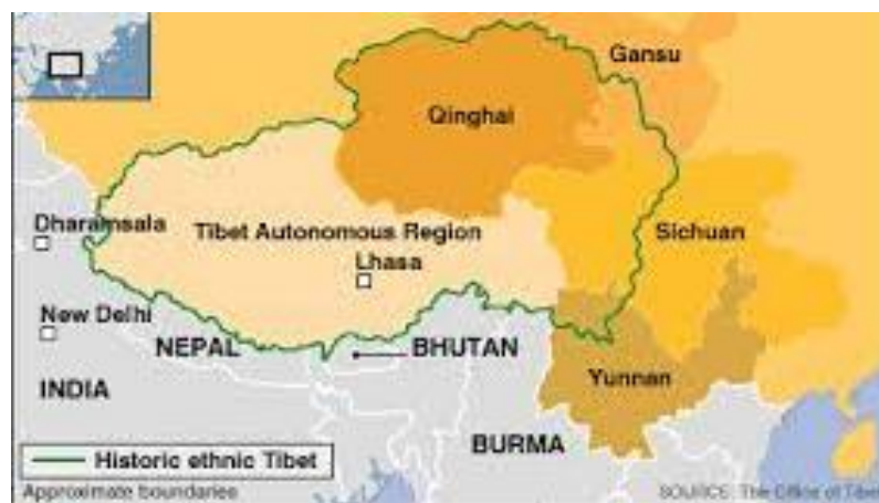
Abbildung 1: Grenzen des historischen Tibets

“Tibetan communities and their language, culture and religions extend far beyond the boundaries of the current Tibetan Autonomous Region and into the provinces of Sichuan, Qinghai and Gansu. [...] These regions are regarded by Tibetans as parts of old Tibet (cultural Tibet, or ethnographic Tibet as it is sometimes called), but to the PRC government they are part of China Proper.” 10